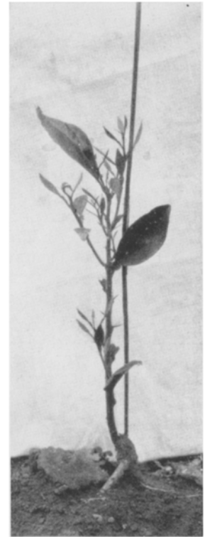
Abb. 3. Absterbende Veredelung von Citrus sinensis auf Citrus Aurantium .

Von den Bastarden der Kombination immun \times anfällig gibt es also schon mehrere, die erkrankt sind. Es muß deshalb mit der Möglichkeit gerechnet werden, daß es unter den F_1 -