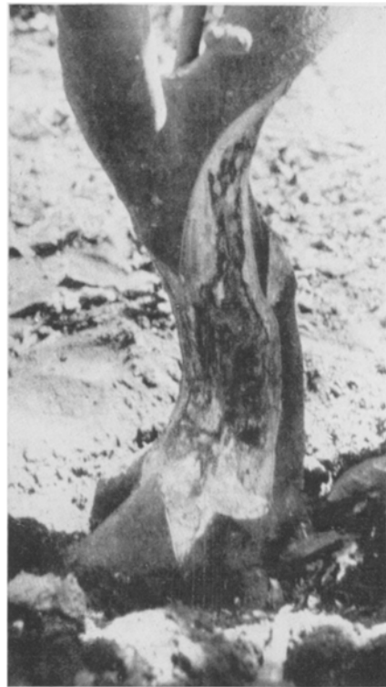
Abb. 1. Stark befallener Baum.

Sofort, nachdem der sehr große Schaden, der durch Phytophthora verursacht wird, bekannt wurde, ist auf Java für djeruk manis, die einheimische Varietät von Citrus sinensis und für die importierten Klone, wie Washington, Naval